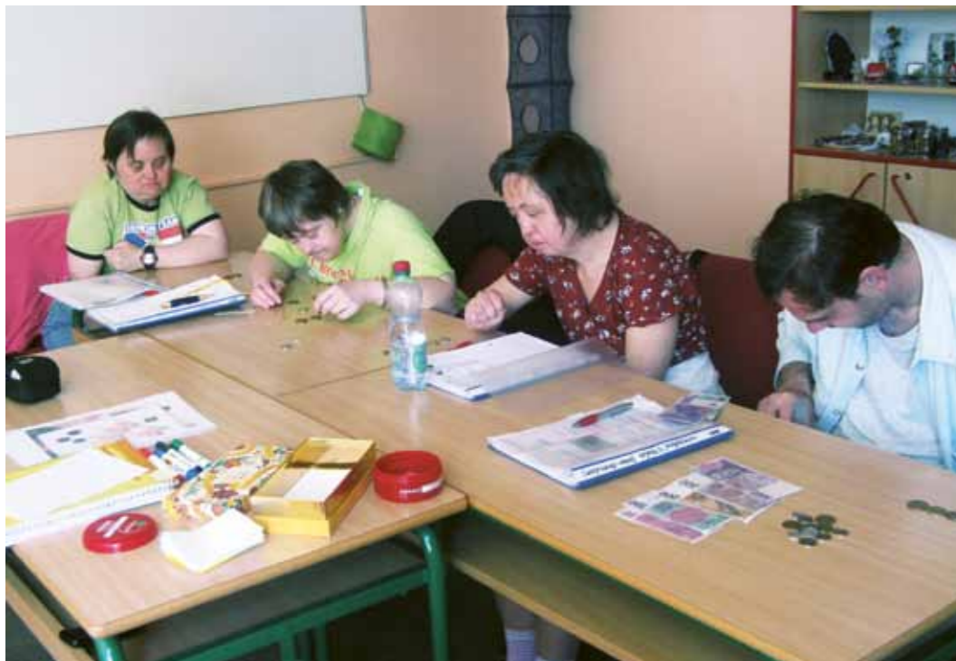
Centrum Karlínium Kurz Hospodaření s penězi

ve připravují na zaměstnání na otevřeném trhu práce. Cílem těchto kurzů je posílit sociální dovednosti studentů, které jim napomohou adaptovat se na prostředí většinové společnosti a tak zvýšit své šance na otevřeném trhu práce i v dalších oblastech života. Kurzy zahrnují témata komunikace, vhodného chování, vztahů, sebeprezentace, sebeprosazení, řešení konfliktů.