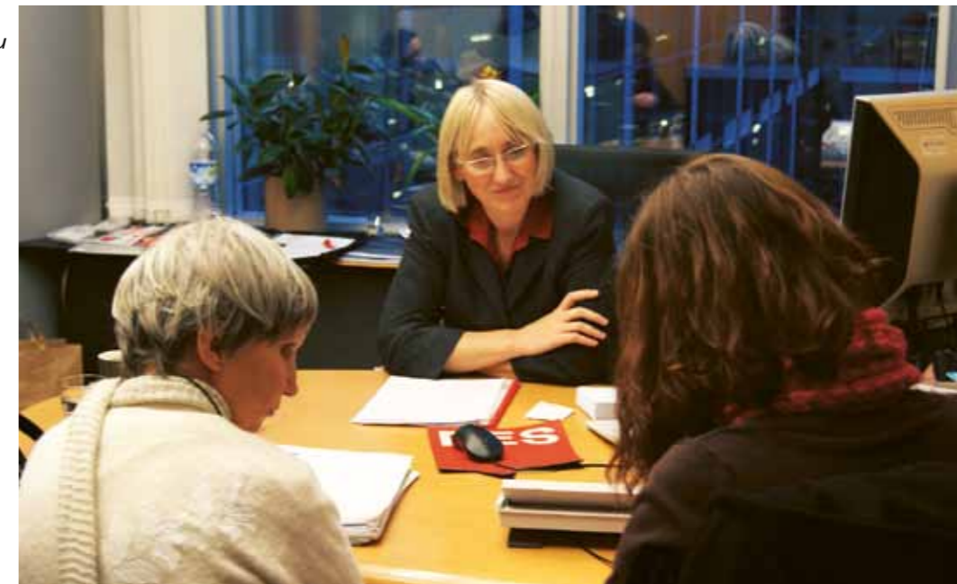
Setkání s poslankyní Evropského parlamentu v rámci projektu ADAP

Ve dnech 26.–28. listopadu 2010 se v rekreačním středisku Záseka u Radostína nad Oslavou sešli sebeobhájci z České republiky a ze Slovenska, aby hovořili na téma Úmluva OSN o právech lidí s postižením. Hlavním cílem tohoto mezinárodního setkání bylo především zvnitřnění si a lepší pochopení Úmluvy. Víkend jsme uspořádali se záměrem, aby sami sebeobhájci uměli vlastními slovy říct, co Úmluva znamená a v čem je pro lidi s postižením důležitá. Každá skupina sebeobhájců, která na víkend přijela, prezentovala jeden vybraný článek z Úmluvy ostatním sebeobhájcům. Sebeobhájci však jen neprezentovali to, jak to je napsáno v Úmluvě, ale vše zasazovali do svého vlastního života a sami nakonec naplánovali akce, které povedou k tomu, aby se jejich článek stal opravdu skutečností. Na listopadový seminář navážeme dalšími aktivitami v roce 2011. Články Úmluvy OSN prezentované sebeobhájci: čl. 12 Před zákonem jsme si všichni rovni, čl. 24 Vzdělávání, čl. 19 Nezávislý způsob života a začlenění do společnosti, čl. 23 Domov a rodina. Víkendu se zúčastnilo 15 účastníků i s asistenty sebeobhájců.