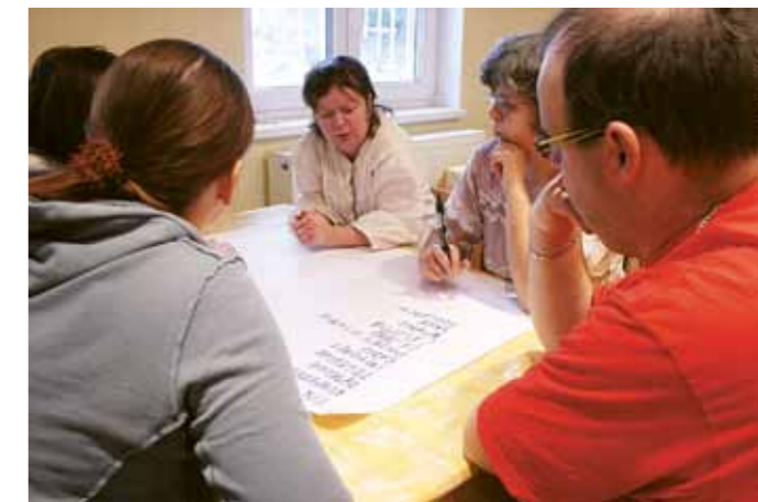
Víkend pro sebeobhájce z ČR a SR, Zásoka u Radostína 2010 Úmluva OSN o právech lidí s mentálním postižením

K dalším tématům setkání patřily otázky sebeobhajování, osamostatňování synů a dcer, a účinná pomoc naší organizace při řešení problémů pečujících rodin o osoby s mentálním postižením. Z diskuze o směrech budoucího rozvoje SPMP jsme čerpali řadu zajímavých podnětů a připomínek které byly později zpracovány do materiálů pro XII. Národní konferenci SPMP.