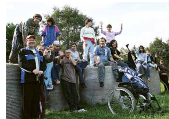
Víkend pro sebe, Nesvačily 2010

V září 2010 jsme zorganizovali akci pro osoby s mentálním postižením s názvem Víkend pro sebe – O vztazích a komunikaci. V příjemném prostředí rekreačního střediska v Nesvačilech jsme procvičovali zážitkovou formou dovednosti, které mohou osoby s mentálním postižením využívat ve svém osobním životě – co to jsou vztahy, jak se v nich orientovat a chovat. Důležitým aspektem tohoto setkání byla skutečnost, že se víkendu účastnili lidi s mentálním postižením sami za sebe – nebyli s nimi rodiče ani asistenti. Měli tak možnost otevřít i témata, která nemají často s kým sdílet.