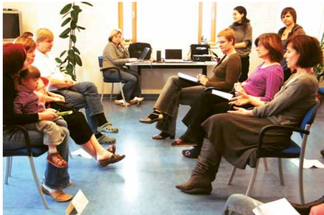
Seminář pro rodiče, Praha 2010 Vzdělávání dětí s mentálním postižením v inkluzivním prostředí

na téma Vzdělávání dětí s mentálním postižením v inkluzivním prostředí. Tyto semináře se konaly v Praze a Brně. Jejich hlavním cílem bylo seznámit rodiče se současnou situací vzdělávání v inkluzivním prostředí v České republice, vytvořit prostor pro sdílení zkušeností a podpořit odhodlání vzdělávat své děti podle jejich potřeb. Seminářů se účastnili rodiče z celé ČR. Šlo jak o rodiče, jejichž dítě chodí do běžné školy, tak o rodiče, kteří se teprve rozhodují, jaký typ školy pro své dítě zvolí. Rodiče v rámci těchto seminářů identifikovali určité typy problémů, jako např. negativní postoj odborníků, neochota škol spolupracovat s rodiči, nedostatek financí na pedagogické asistenty apod.