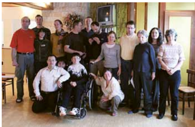
Víkend pro sebeobhájce z ČR a SR, Zásoka u Radostína 2010 Úmluva OSN o právech lidí s mentálním postižením

Psychomotorická rehabilitace pro osoby s mentálním postižením a mentální postižením s více vadami byla zajišťována v roce 2010 našimi členskými organizacemi v 26 okresech. Průměrně se v jednom okrese koná 4 až 6 různých kroužků, např. psychomotorická rehabilitace, rehabilitační cvičení, arteterapie, muzikoterapie, ergoterapie, logopedická cvičení, plavání, hipoterapie, canisterapie, sebeobsluha a příprava na samostatný život) a celá řada jednorázových akcí. Tyto aktivity umožňují po skončení školy rozvíjet dále své schopnosti a dovednosti a zároveň se pravidelně setkávat se svými kamarády. Celkový počet uživatelů těchto služeb v roce 2010 překročil 6 000 osob.